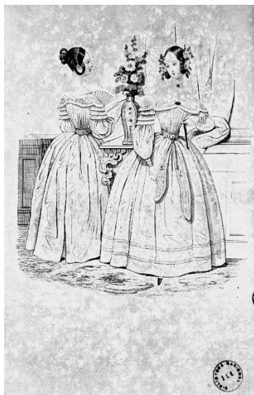
Figura 2. Correio das Modas , 6 dez. 1840. Bibl. Nacional do Rio de Janeiro.

A despeito do que dissemos no último boletim de modas acerca das mangas justas, algumas Senhoras, que não podem ser taxadas por de mau gosto, usam ainda dessas mangas, e na última brilhante reunião da sociedade filarmônica, nos últimos teatros viram-se mangas justas que muito assentavam em braços bem torneados e bem proporcionados: — nem nós dissemos que as mangas largas tinham excluído de todo dos mais elegantes salões suas rivais, pelo contrário afirmamos, sob a palavra honrada dos nossos colegas de Paris, que as Senhoras que primam por seu bom gosto, e que de alguma forma dirigem a moda, não desdenhavam as mangas justas. Seja como for: ao Correio incumbe amoldar-se a todos os gostos; e pois pensamos que era dever nosso, não preterir por decreto de nossa vontade os figurinos que indicam as mais elegantes formas dessas mangas.